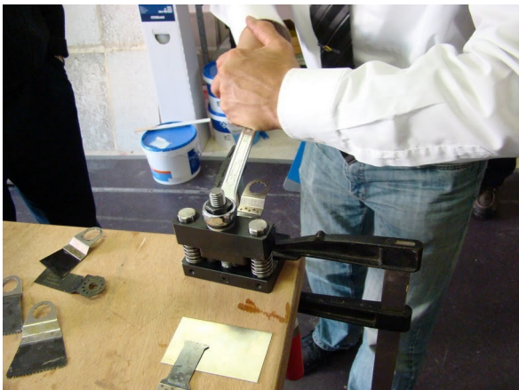
Kijken of alles vrijloopt. Eventueel oude snijstrips verwijderen. Dan goed aandraaien.