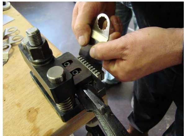
Vertanding zetten. Na elke knipbeurt knipstempel schoonmaken. Oude resten verwijderen en vrijloop controleren.